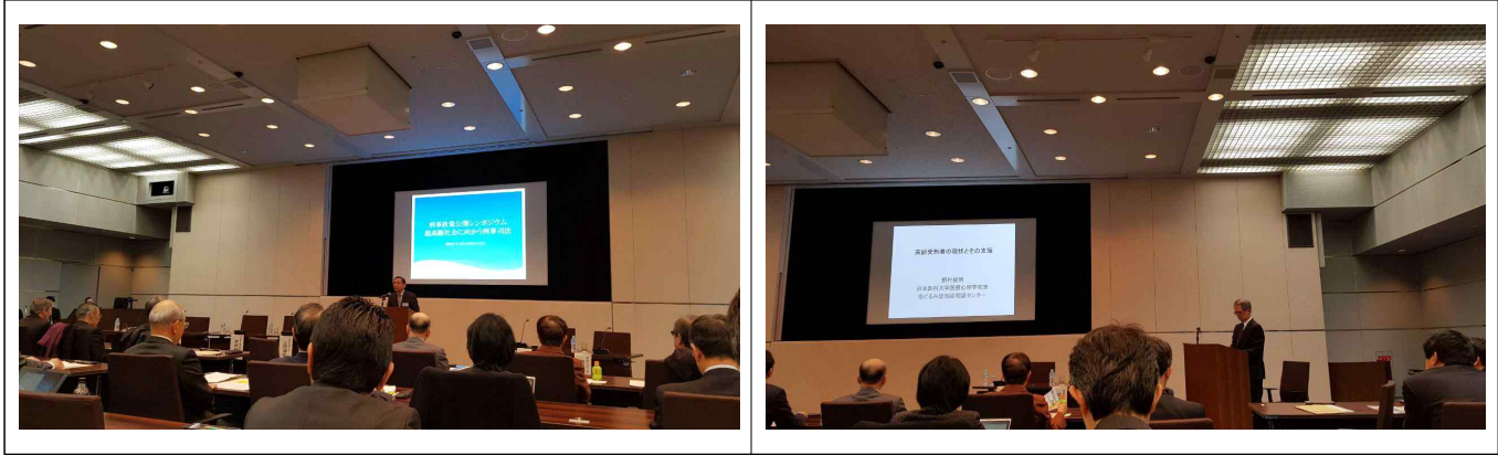
개회사 및 기조강연 모습

일본의과대학 교수로 재직 중이며, 최근 고령자에 의한 범죄문제 대해서 주로 형사 시설(교도소)에서 수행중인 고령자의 인지기능과 개인프로필 조사를 실시하였는데, 그 결과를 이번 기조강연에서 발표하였음.